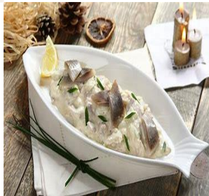
Śledź w śmietanie