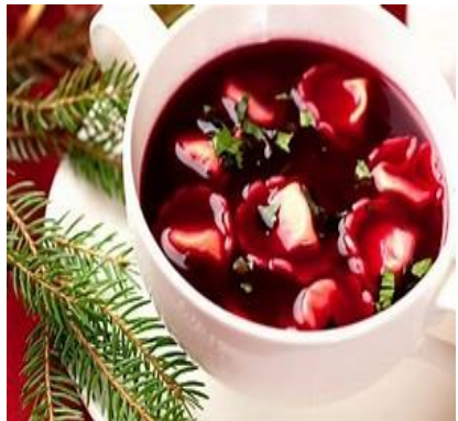
Barszcz czerwony z uszkami