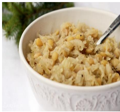
Kapusta z grochem