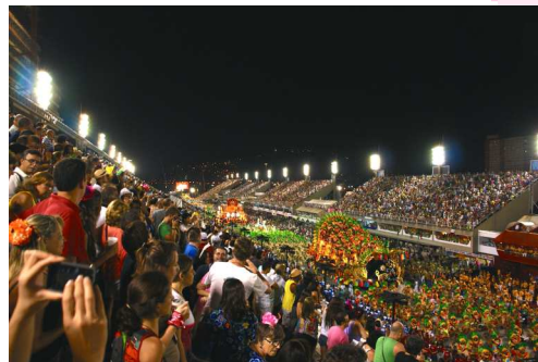
elementem wymyślnych strojów.

Wenecja, która już od średniowiecza słynie z karnawału, równie ciekawie świętuje ten czas. Zabawa trwa tam dokładnie jedenaście dni. Rozpoczyna się w sobotę przed tłustym czwartkiem, a kończy się w tłusty wtorek. Na szczególną uwagę zasługują zdobione maski, które są nieodłącznym