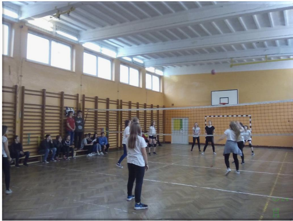
Duża sala gimnastyczna na parterze