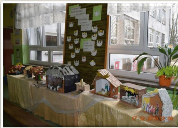
Konkurs recytatorski "Magia Świąt Bożego Narodzenia"