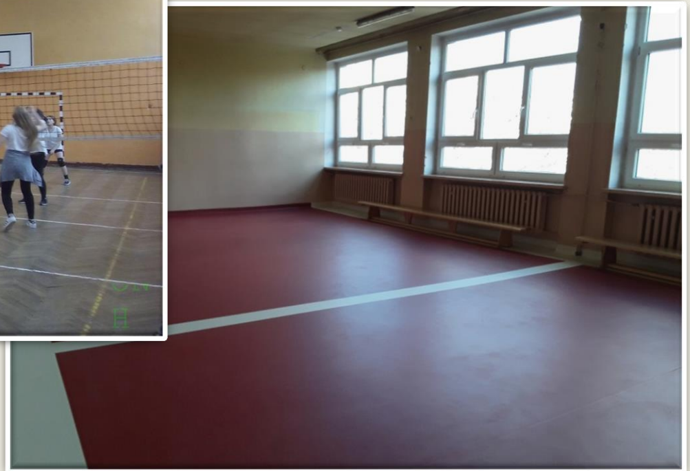
Mała sala na II piętrze